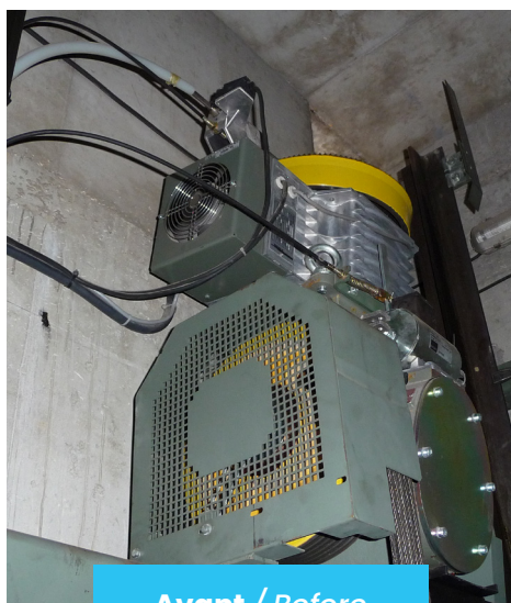
Avant / Before