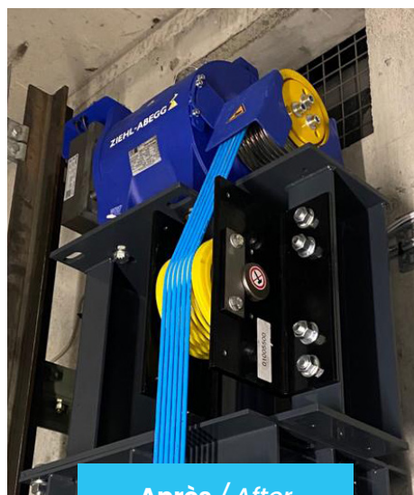
Après / After