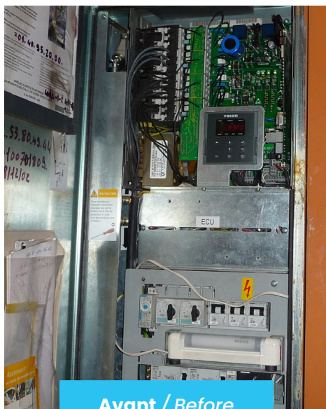
Avant / Before